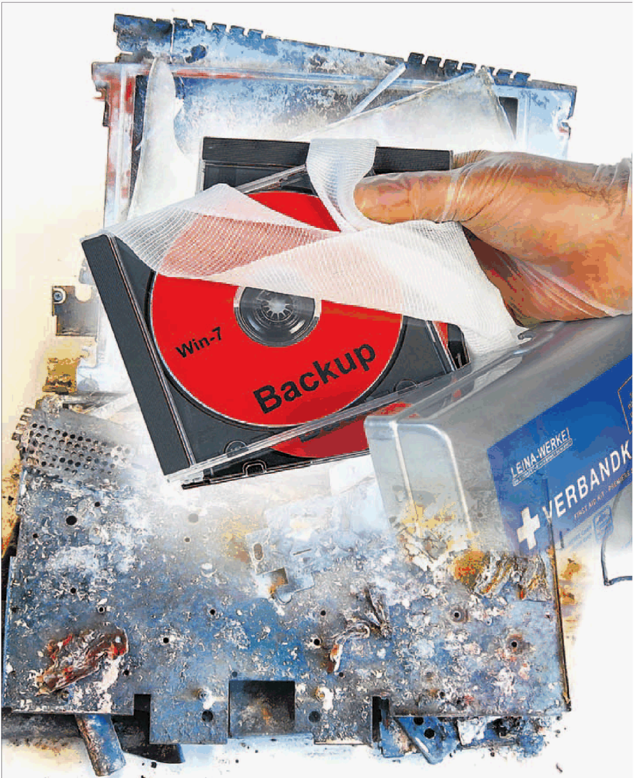
Selbst ein Totalschaden des Rechners muss keine Katastrophe sein, wenn die wertvollen Daten in einem Backup gesichert sind.