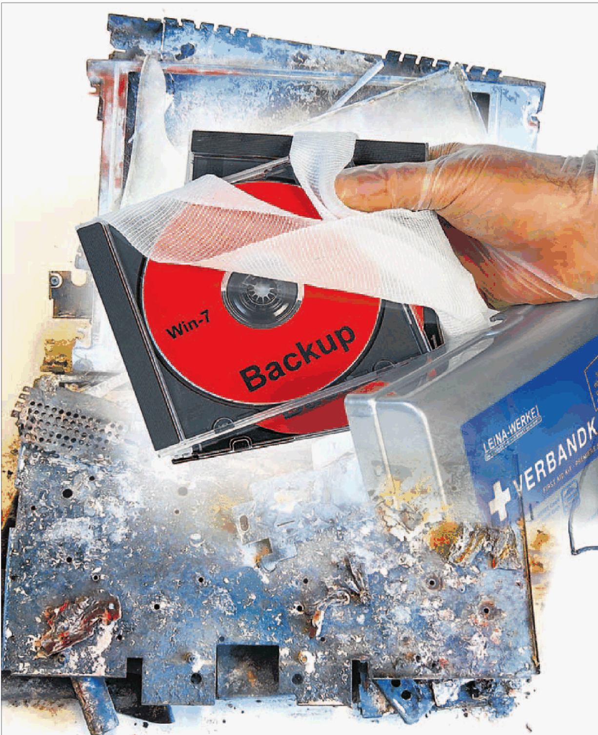
Selbst ein Totalschaden des Rechners muss keine Katastrophe sein, wenn die wertvollen Daten in einem Backup gesichert sind.