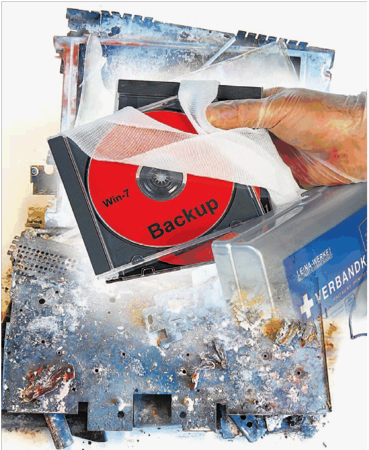
Selbst ein Totalschaden des Rechners muss keine Katastrophe sein, wenn die wertvollen Daten in einem Backup gesichert sind.