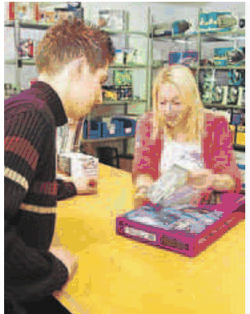
Eine kompetente, möglichst ausführliche Beratung ist das A und O beim PC-Kauf.