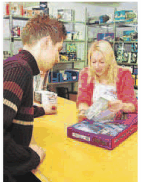
Eine kompetente, möglichst ausführliche Beratung ist das A und O beim PC-Kauf.